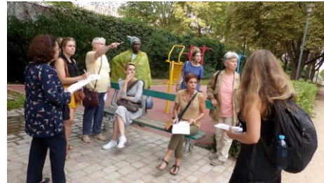
On échange au cours d'un arrêt