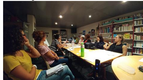
Debrief à l'issue de la 1 ère marche