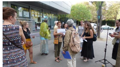
Le départ pour la marche