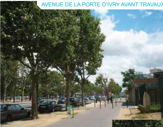
AVENUE DE LA PORTE D'IVRY AVANT TRAVAUX