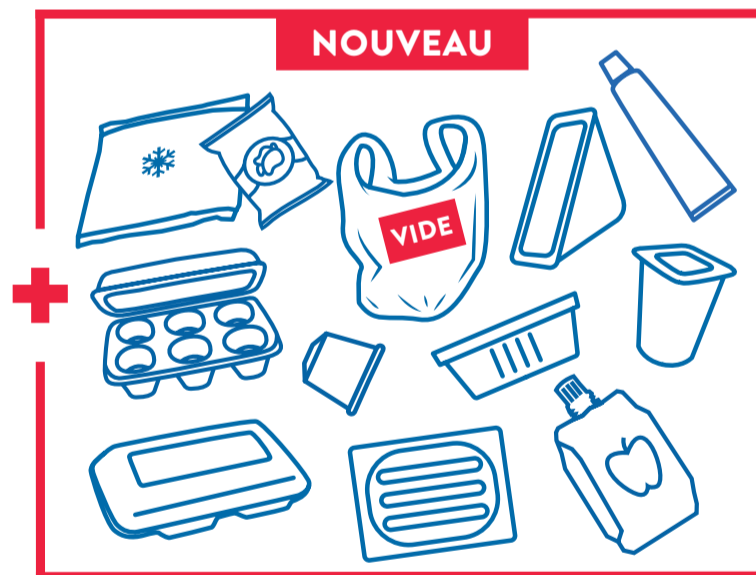
TOUS LES AUTRES EMBALLAGES EN PLASTIQUE ET MÉTAL (ACIER, ALU...)

LES BOUCHONS ET COUVERCLES SONT ACCEPTÉS. LES EMBALLAGES DOIVENT ÊTRE BIEN VIDÉS ET EN VRAC! PAS BESOIN DE LES LAVER.