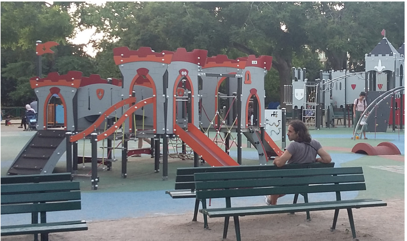
Jeux pour enfants, parc de Choisy

Certains participants ont discuté entre eux de la pertinence d'installer de nouveaux jeux. Le premier constat était de considérer que le quartier est entouré de parcs et aires de jeux, mais après discussion certains ont imaginé que des espaces de jeux aux pieds des immeubles éviteraient aux enfants de traverser des routes et pourraient créer une occupation positive des espaces.