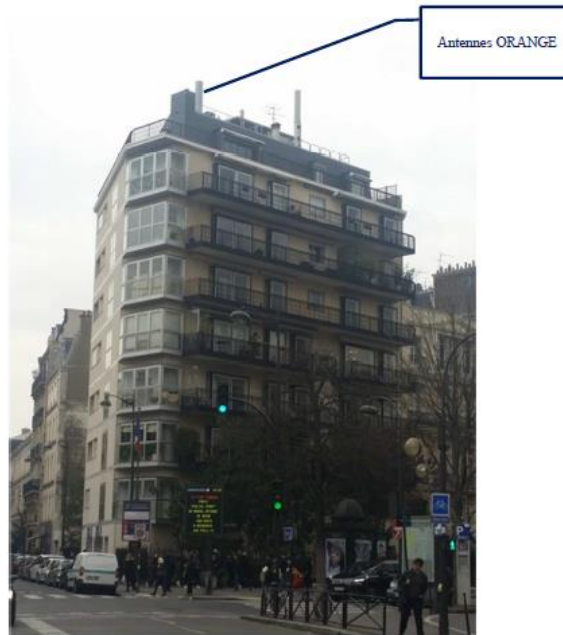
Etat projeté : Aucun impact visuel