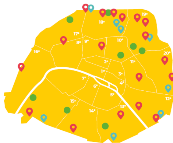
Carte des ludothèques de plein air et des Ludomouv'

Afin de faciliter l'accès des familles à des activités culturelles , un nouveau conservatoire ouvrira ses portes au 2, impasse Vindal situé dans le 14 ème arrondissement à partir du mois de novembre 2019. Deux nouvelles bibliothèques ouvriront dans le 14 ème et le 20 ème arrondissement tandis que la bibliothèque Hergé située dans le 19 ème bénéficiera d'une nouvelle salle d'animation pour étendre les activités de la section jeunesse de la bibliothèque également rénovée.