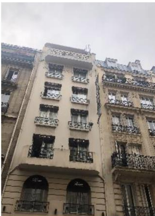
Photomontage du site vu depuis la rue