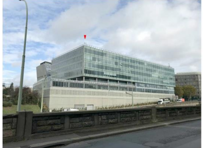
Etat du projet :