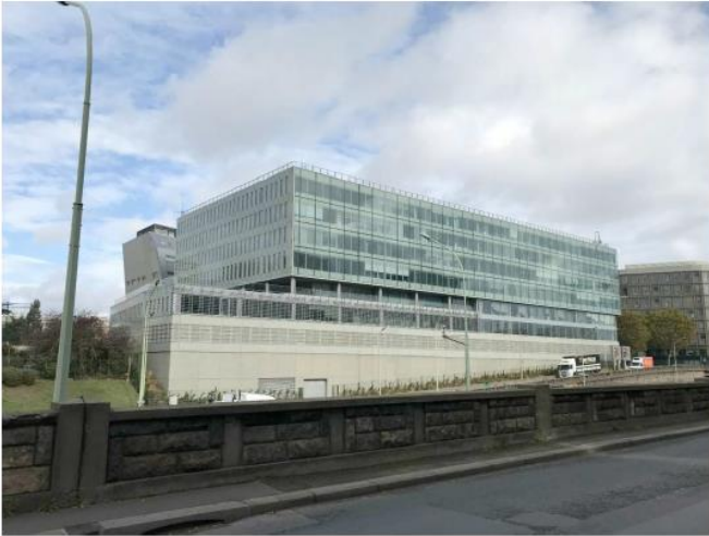
Etat de l'existant :