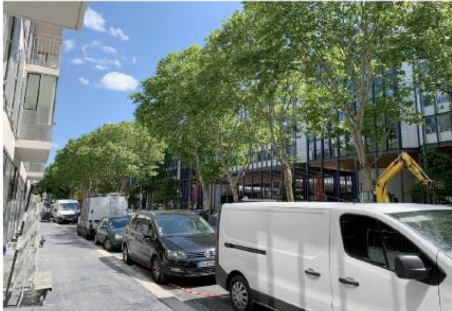
Les antennes ne sont pas visibles depuis ce point de vue