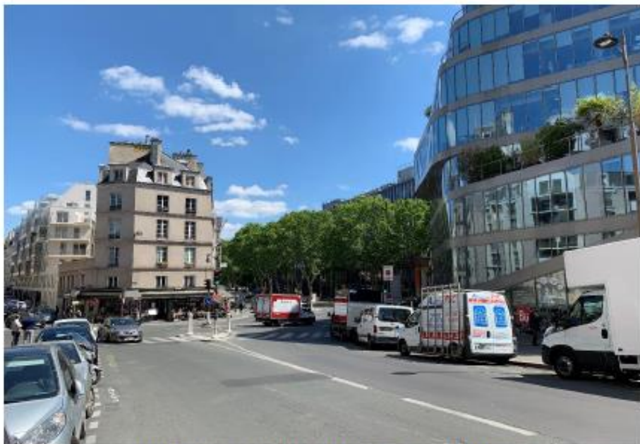
Les antennes ne sont pas visibles depuis ce point de vue.