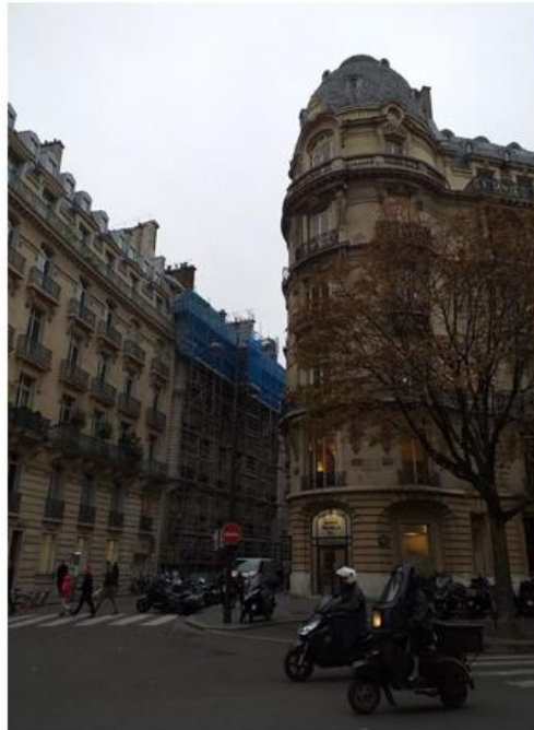
Photo du site vu depuis la rue