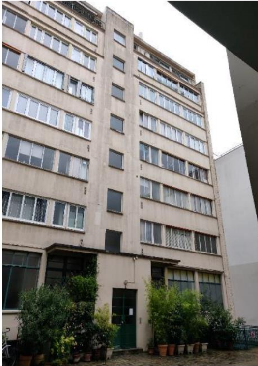
Photo du site vu depuis la rue