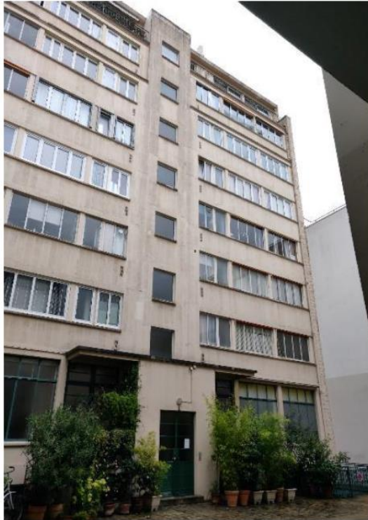
Photo du site vu depuis la rue