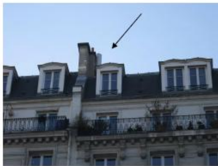
PHOTOMONTAGE APRES TRAVAUX (SANS IMPACT VISUEL)