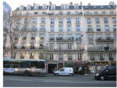
PHOTO DEPUIS LA RUE AVANT TRAVAUX