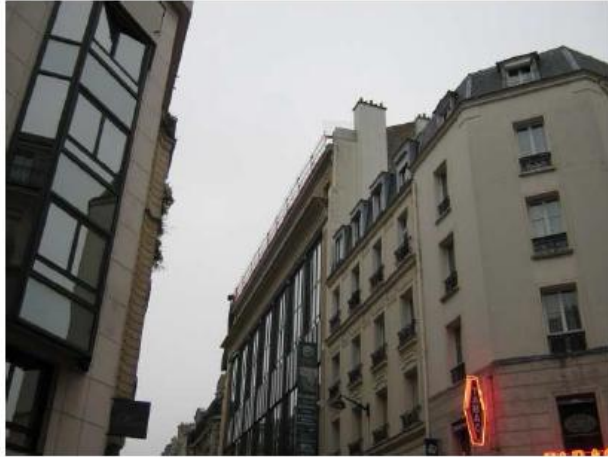
Vue avant travaux Rue des Sablons