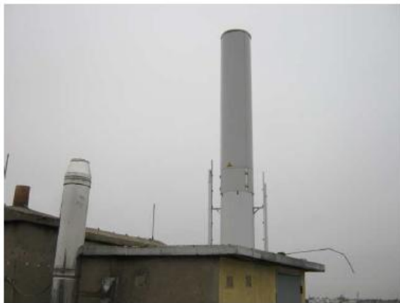
Vue S1/S2 depuis la toiture avant travaux