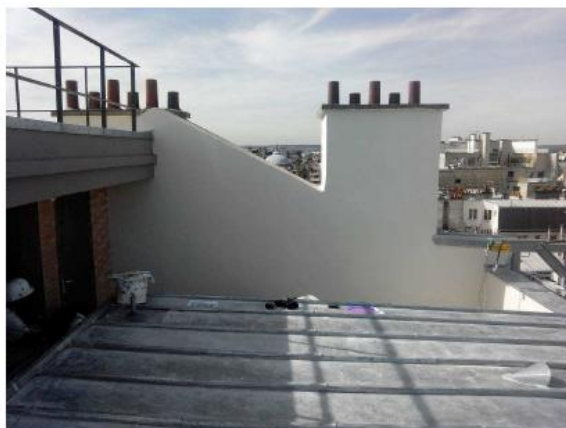
Vue S3 depuis la toiture avant travaux