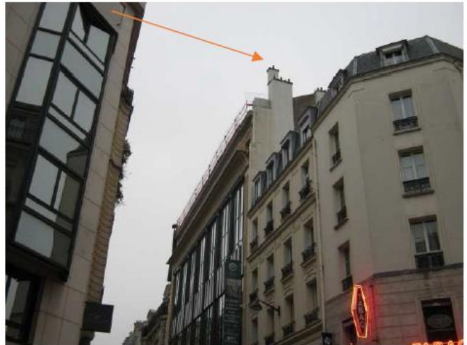
Vue après travaux Rue des Sablons Les installations sont intégrées en fausse cheminée reprenant le RAL et texture de la cheminée existante