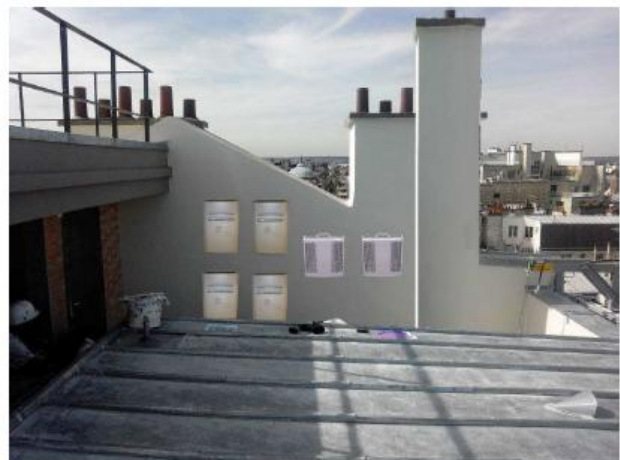
Vue S3 depuis la toiture après travaux