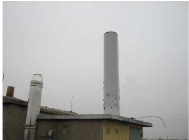
Vue S1/S2 depuis la toiture après travaux