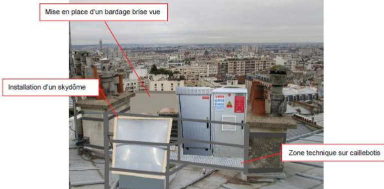
PHOTO 1/ Avant travaux