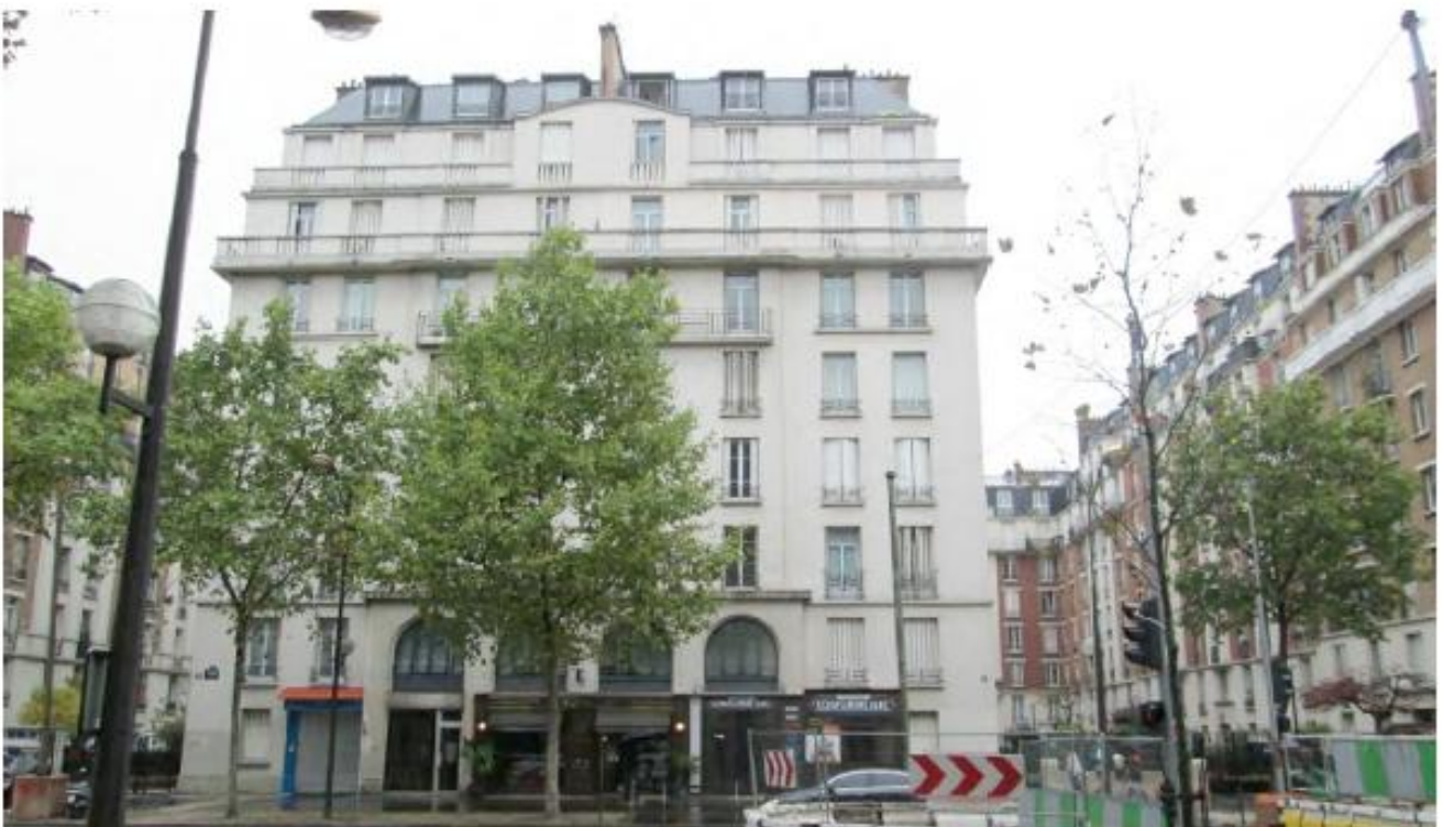
DP 7 Photomontage du projet (les antennes ne sont pas visibles depuis ce point de vue).