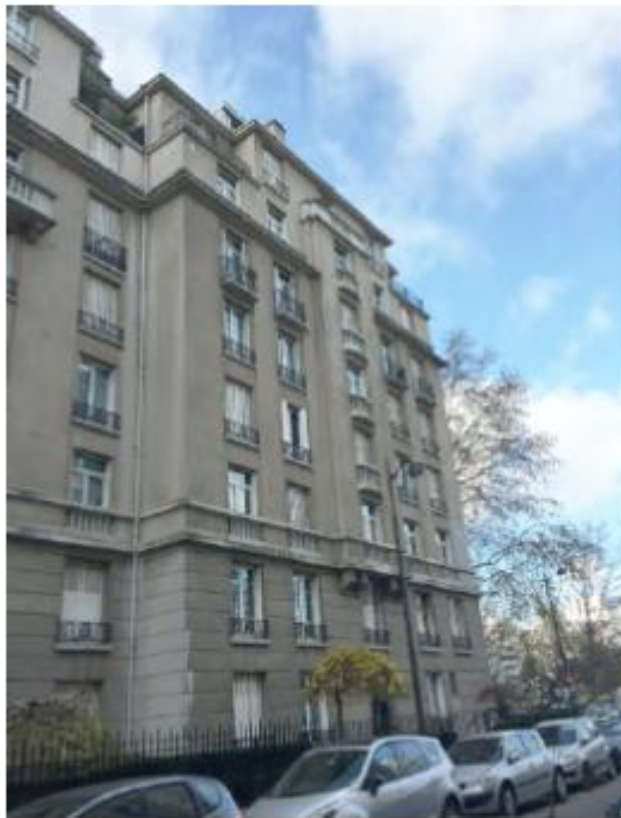
DP. 7. 1. Photo. de l'existant