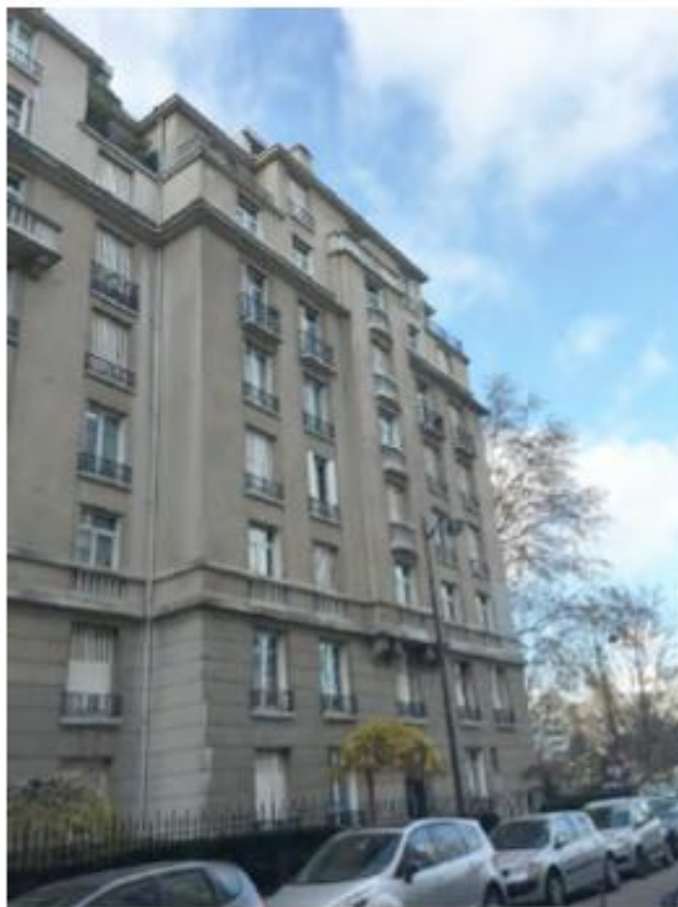
DP. 6. 1. Photomontage du projet (l'installation n'est pas visible depuis ce point de vue)