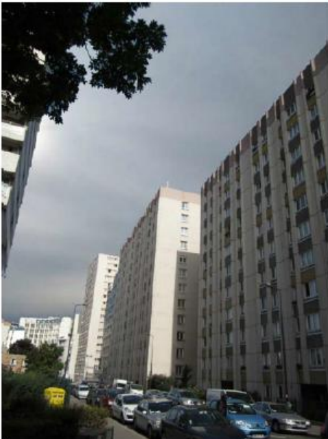
DP 7.1 - Photo de l'existant

REPLACEMENT À L'IDENTIQUE SANS IMPACT VISUEL