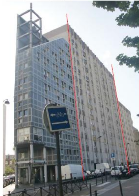
DP 8 - Photo du projet, vue lointaine Les antennes ne sont pas visibles depuis ce point de vue