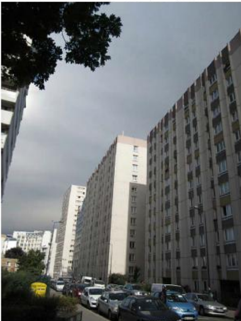
DP 6.1 - Photo du projet