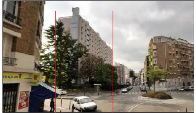
DP 8 - Photo de l'existant, vue lointaine