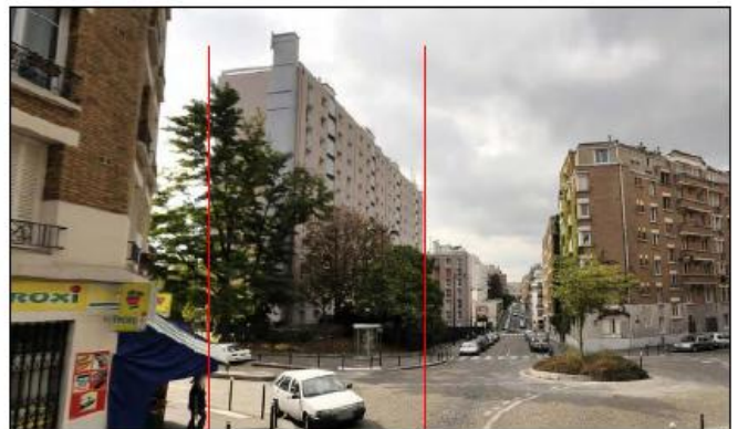
DP 8 - Photo du projet, vue lointaine