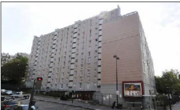
DP 6.1 - Photo du projet