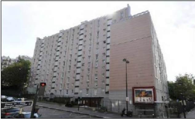
DP 7.1 - Photo de l'existant