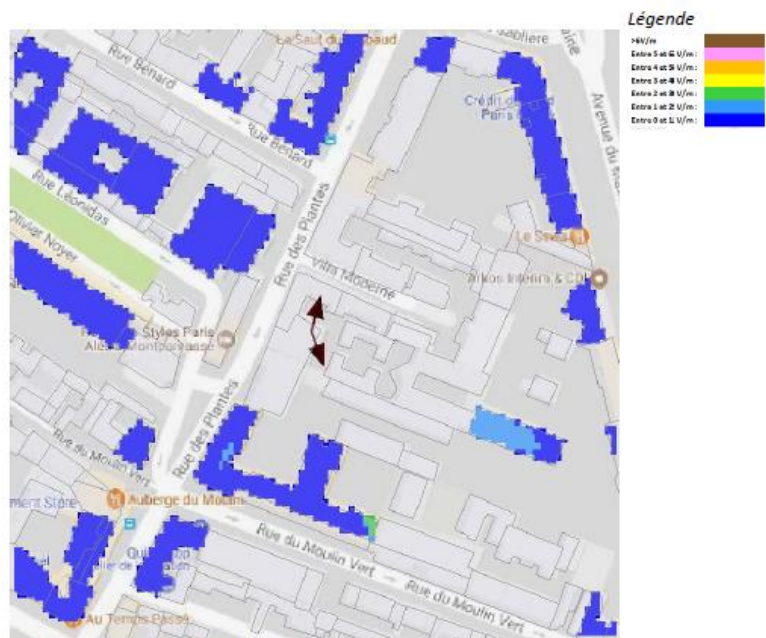
[Fond de carte (Google Roadmap), source : Google] [Logiciel de simulation : Atoll Radio]

Pour l'antenne orientée dans l'azimut 160°, le niveau maximal calculé est compris entre 2-3 V/m. La hauteur correspondante est de 22.50 m.