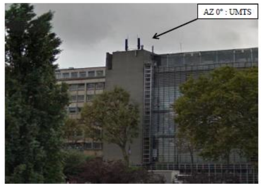
Pont de Sully