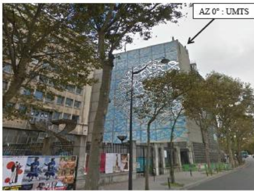
Quai Saint Bernard