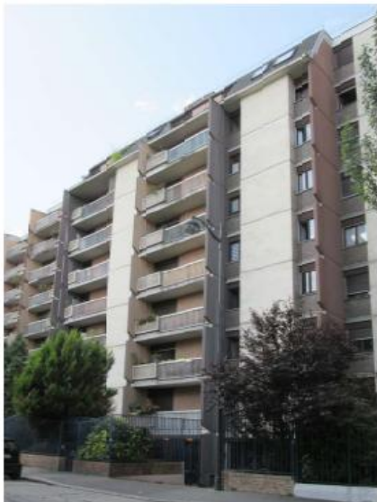
DP 6.1 - Photo du projet (Les antennes ne sont pas visibles depuis ce point de vue)