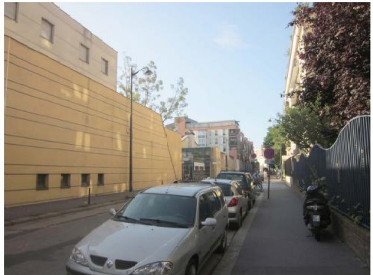
DP 8 - Photo du projet, vue lointaine (Les antennes ne sont pas visibles depuis ce point de vue)