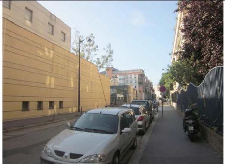
DP 8 - Photo de l'existant, vue lointaine