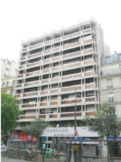
DP 6.1 - Photo du projet