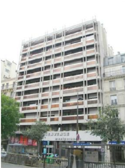
DP 7.1 - Photo de l'existant