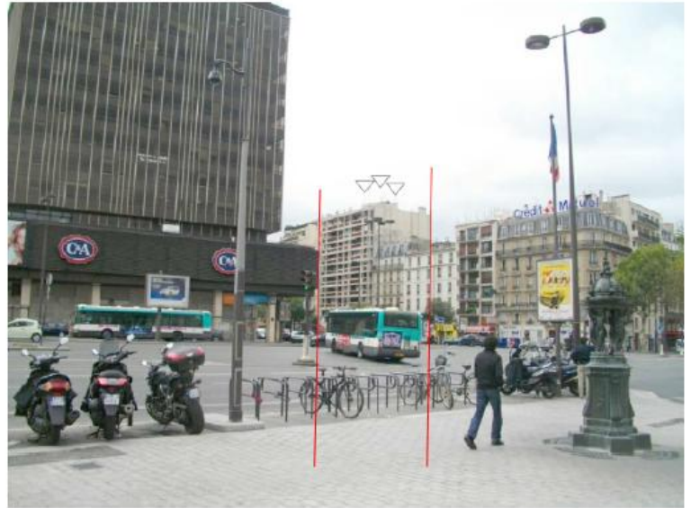
DP 8 - Photo de l'existant, vue lointaine