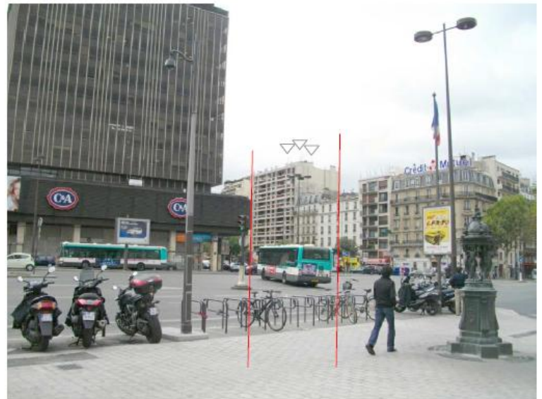
DP 8 - Photo du projet, vue lointaine