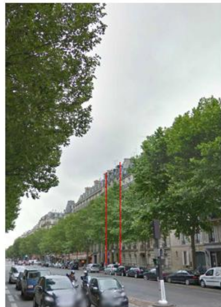
DP 8 - Photo du projet, vue lointaine (l'antenne est n'est pas visible depuis ce point de vue)