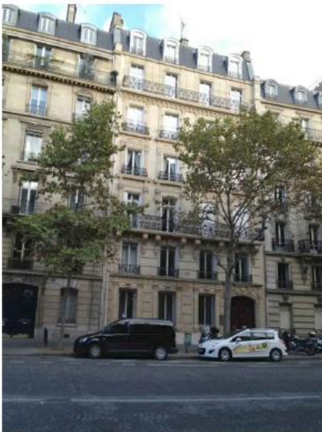
DP 6.1 - Photo du projet (l'antenne est n'est pas visible depuis ce point de vue)