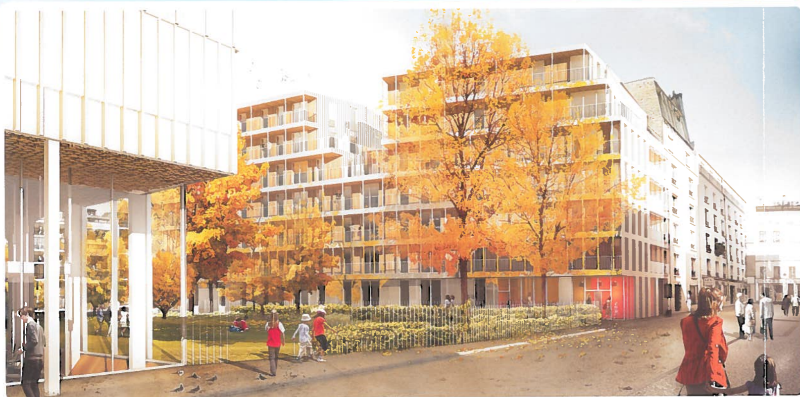
Selon les résultats de la concertation, ce nouvel espace vert pourrait être aménagé avec une pelouse, des espaces de repos ainsi qu'une aire de jeux pour enfants.