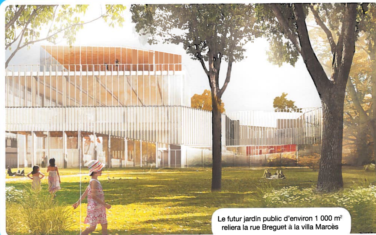
Le futur jardin public d'environ 1 000 m 2 reliera la rue Breguet à la villa Marcès

En cœur de parcelle, un jardin traversant de près de 1 000 m 2 offrira une formidable respiration au quartier de la rue Breguet jusqu'à la villa Marcès. La concertation qui va s'ouvrir permettra d'en préciser le programme.