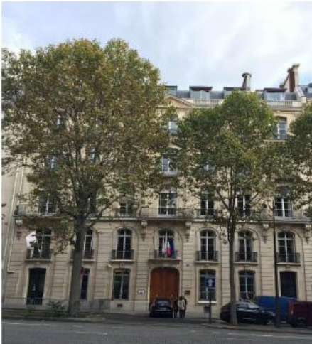
Etat du projet :