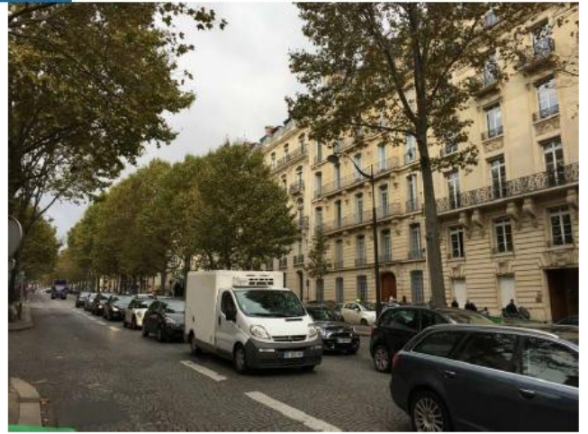
Etat de l'existant :