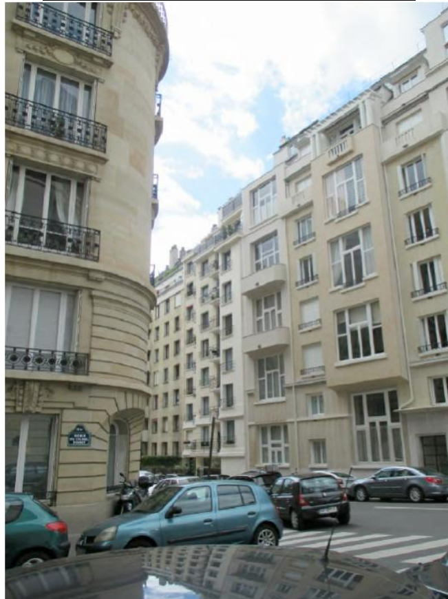
DP.7.1.Photo de l'existant