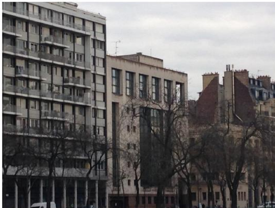
Etat projeté :