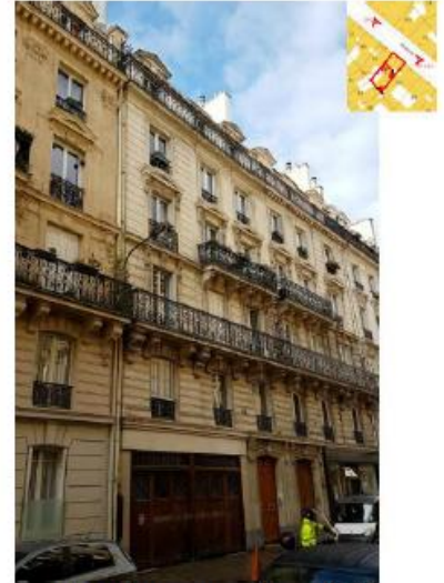
Les antennes ne sont pas visibles