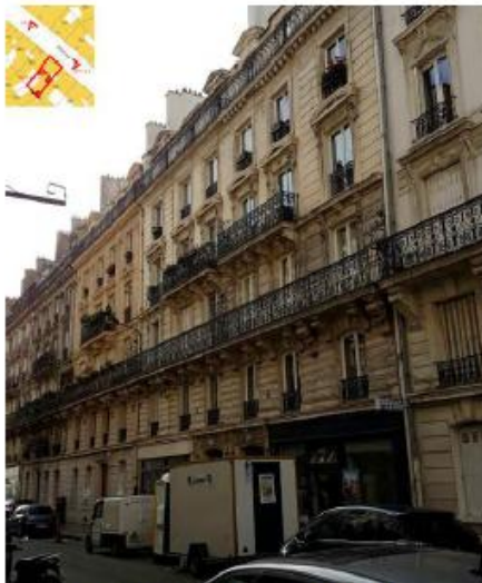
Les antennes ne sont pas visibles