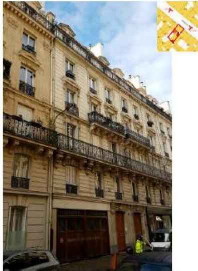
Etat de l'existant :