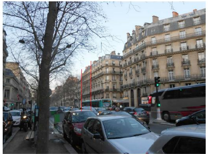
DP 8 - Photo du projet, vue lointaine (les antennes ne sont pas visibles depuis ce point de vue)