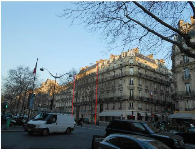
DP 6.1 - Photo du projet