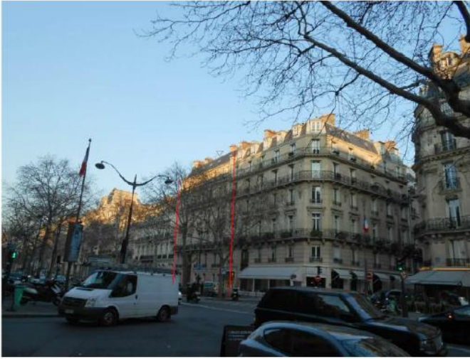
DP 7.1 - Photo de l'existant

REPLACEMENT À L'IDENTIQUE SANS IMPACT VISUEL