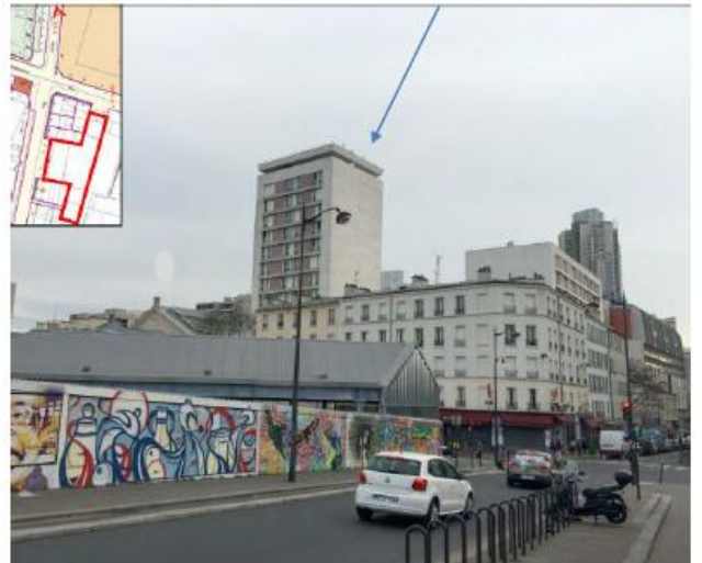
Etat projeté :