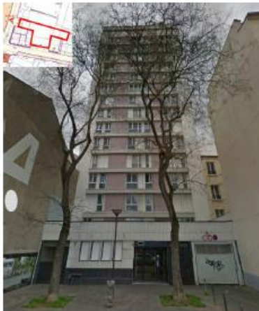
Les antennes ne sont pas visibles