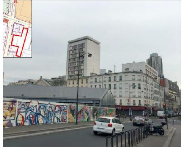
Etat de l'existant :