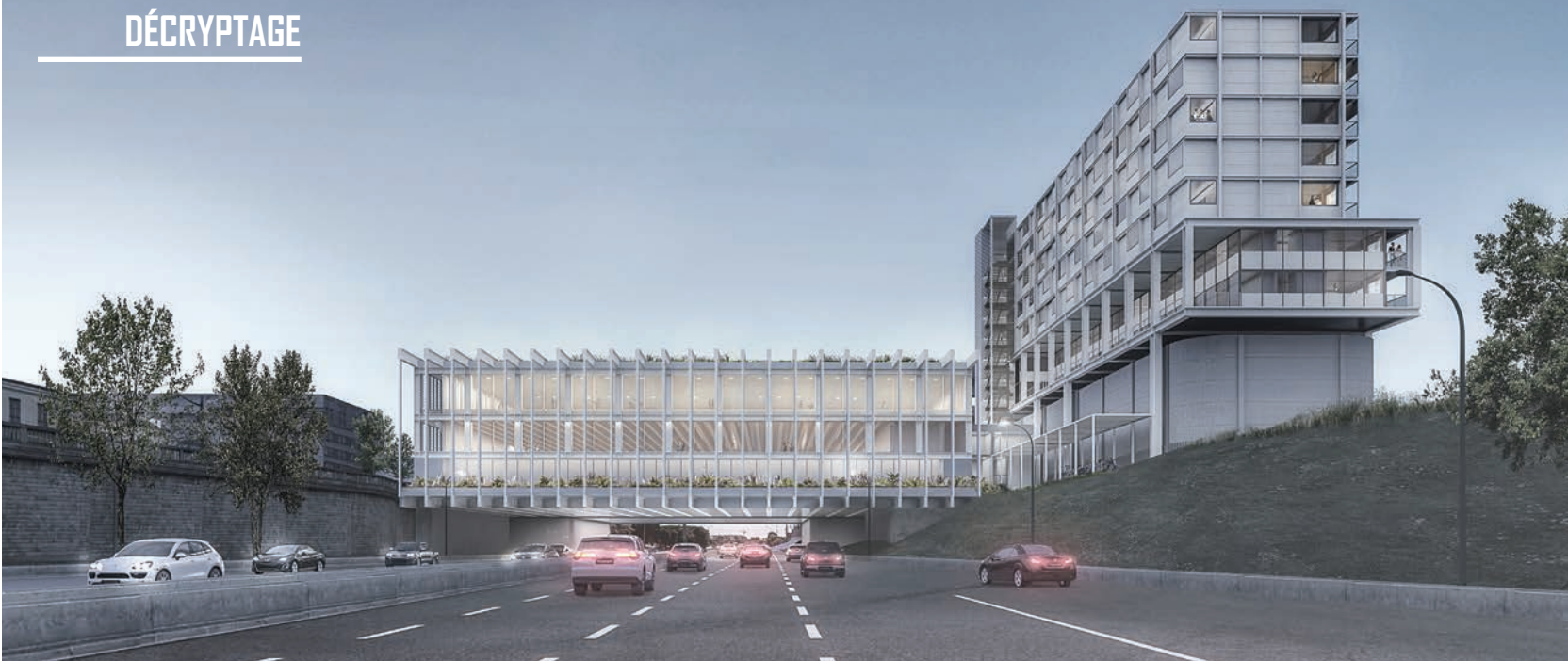
© CAB Architectes / Bourbouze-Graindorge / RATP / Logis-Transports / SEMAPA