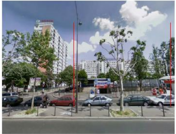
DP 8 - Photo de l'existant, vue lointaine