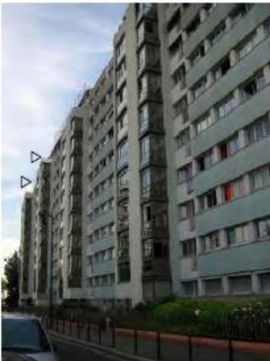
DP 6.1 - Photo du projet