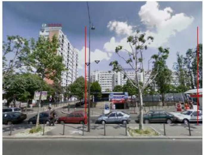
DP 8 - Photo du projet, vue lointaine