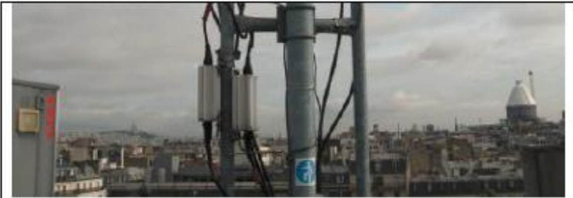
PHOTO DEPUIS LE MAT DE L'ANTENNE AZ : 0°