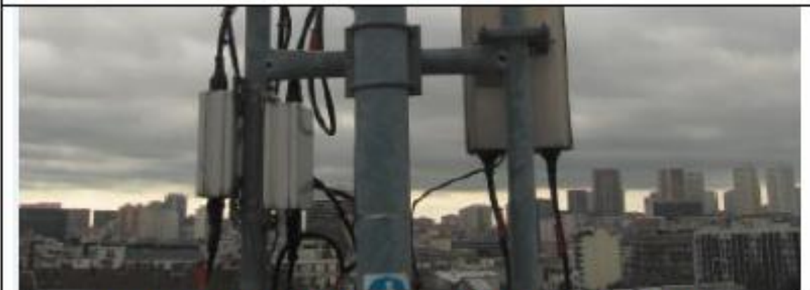
PHOTO DEPUIS LE MAT DE L'ANTENNE AZ : 120°