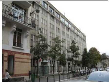
PHOTO DEPUIS LA RUE AVANT TRAVAUX