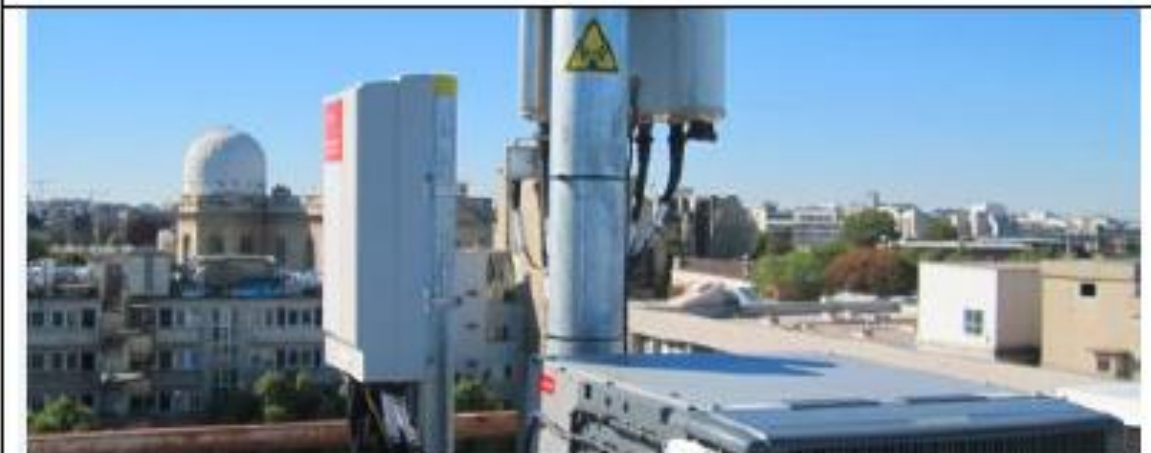
PHOTO DEPUIS LE MAT DE L'ANTENNE AZ : 240°