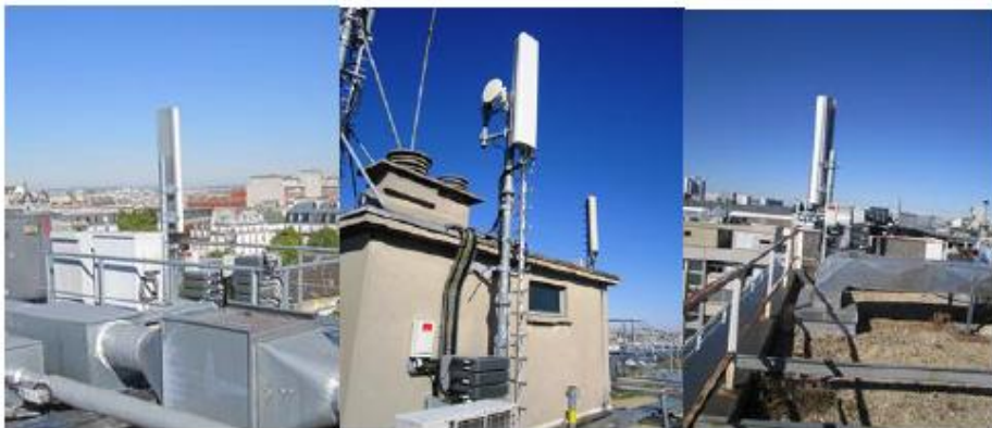
PHOTOMONTAGE APRES TRAVAUX (pas de changement)