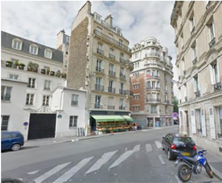
DP. 7.1. Photo. de l'existant