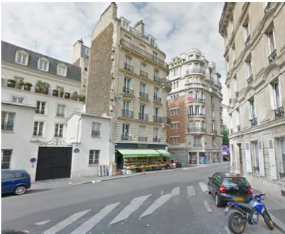
DP. 6.1. Photomontage du projet (L'installation. n'est pas visible depuis ce point de vue)