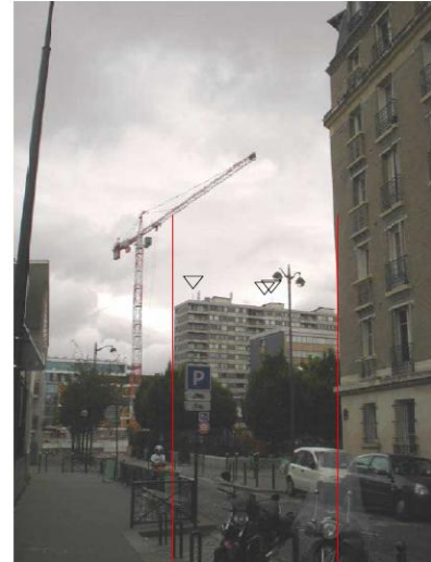
DP 8 - Photo du projet, vue lointaine