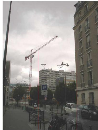
DP 8 - Photo de l'existant, vue lointaine