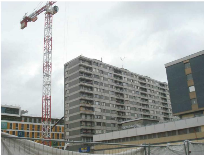
DP 7.1 - Photo de l'existant

REPLACEMENT À L'IDENTIQUE SANS IMPACT VISUEL