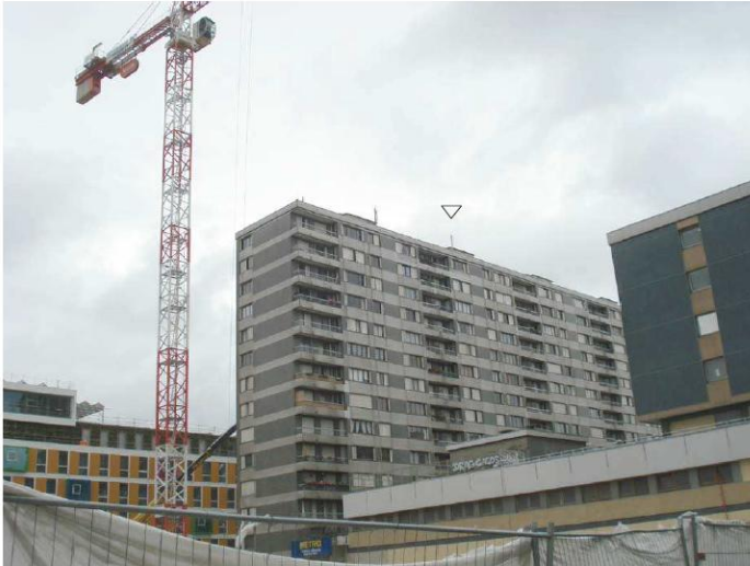
DP 6.1 - Photo du projet