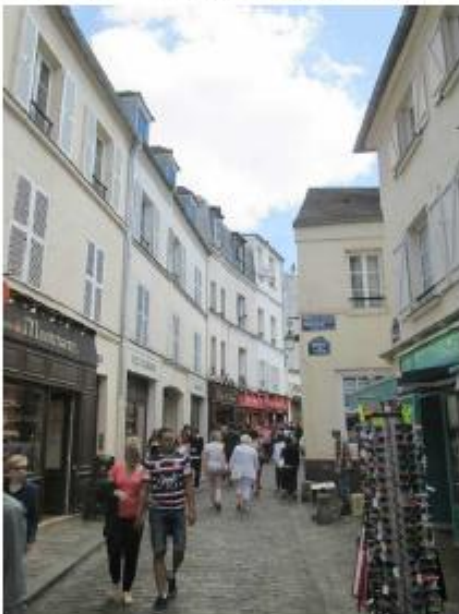
DP 6.1 - Photo du projet (L'antenne n'est pas visible depuis ce point de vu)