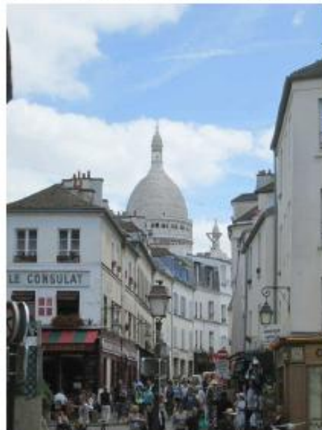
DP 8 - Photo du projet, vue lointaine