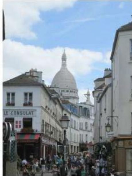
DP 8 - Photo de l'existant, vue lointaine