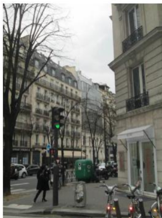
Vue de la rue Pergolèse