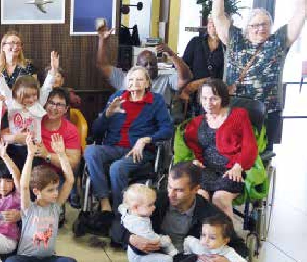
Journée portes ouvertes à l'Ehpad Annie Girardot (cf. encadré)