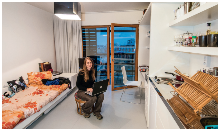
Près de 6 000 logements sont répartis dans 66 résidences universitaires parisiennes.

Elle accueille près de 6 000 étudiants et pas moins de 140 nationalités dans ses 40 maisons. Tous ses occupants sont étudiants en master au minimum, chercheurs, artistes ou sportifs de haut niveau. Il faut également justifier d'une inscription dans un établissement de l'enseignement supérieur d'Île-de-France, ou venir à Paris faire un stage dans le cadre de son cursus. Des commissions d'admission se tiennent chaque mois en fonction des disponibilités. → www.ciup.fr , rubrique « S'inscrire ».