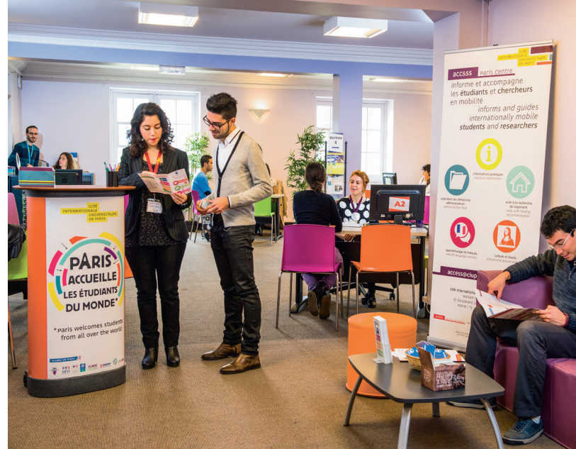
Students finding out about the services on offer at the Cité internationale.

Ils proposent des hébergements temporaires meublés, de la chambre individuelle à l'appartement partagé en passant par le studio. Ils sont destinés aux jeunes âgés de 16 à 25 ans (parfois 30 ans) salariés, apprentis, en formation, à la recherche d'un emploi et étudiants (environ 20 % des places leurs sont réservés). ■ → www.fjt-idf.fr