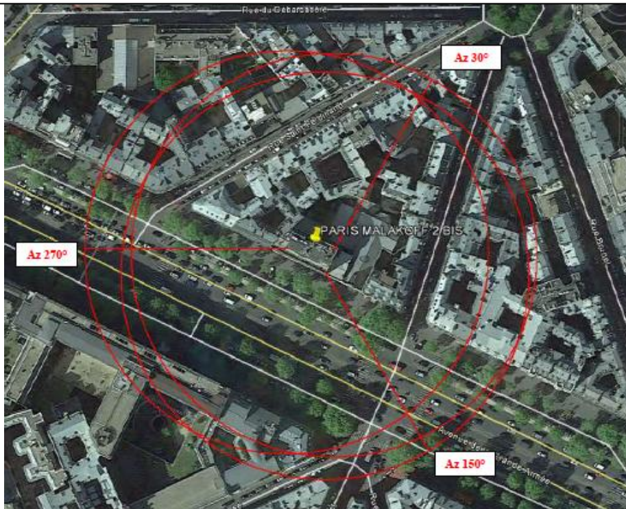
Pas d'établissement particulier dans un rayon de 100m autour des antennes