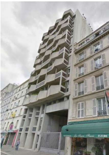
DP 6.1 - Photo du projet (L'antenne n'est pas visible depuis ce point de vue)