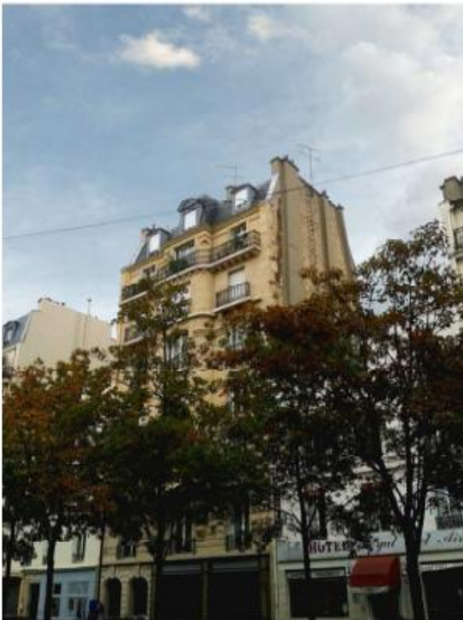
DP 7 Photo de l'existant