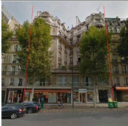
DP7 Photo de l'existant