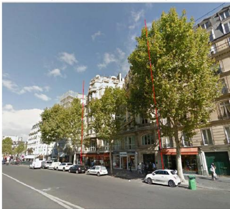
PC 8 - Photo vue de loin