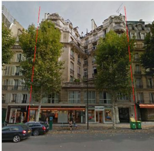
DP 6 Photo du projet (Les antennes sont invisibles depuis ce point de vue)