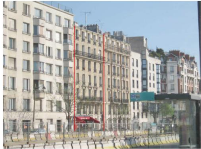
DP 8 - Photo de l'existant, vue lointaine