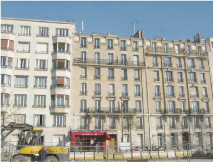
DP 7.1 - Photo de l'existant

REPLACEMENT À L'IDENTIQUE SANS IMPACT VISUEL