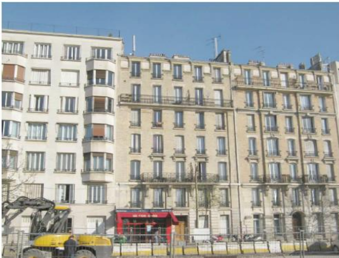
DP 6.1 - Photo du projet