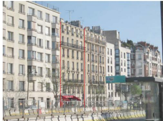
DP 8 - Photo du projet, vue lointaine