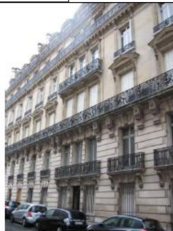
PHOTO DEPUIS LA RUE AVANT TRAVAUX