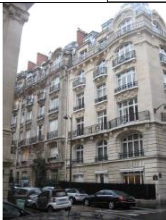
PHOTO DEPUIS LA RUE AVANT TRAVAUX