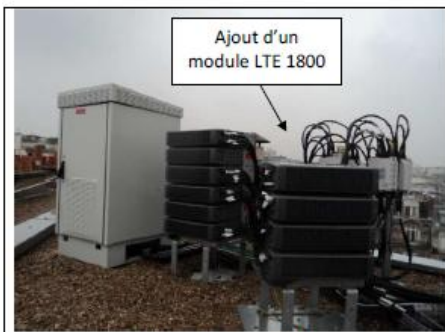
PHOTO APRES TRAVAUX