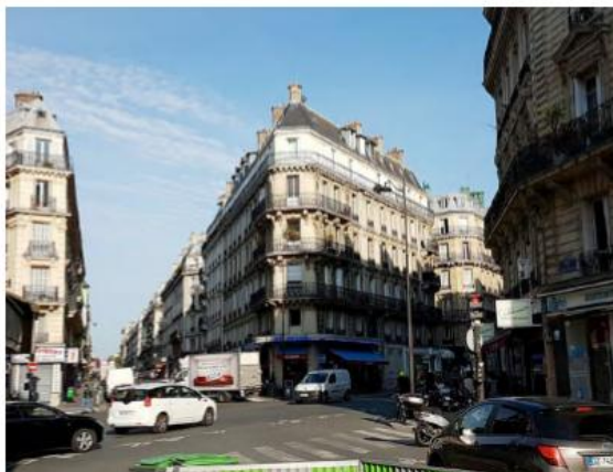
Etat de l'existant :