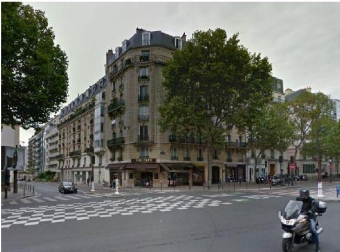
DP 6 Photomontage du projet (Les antennes ne sont pas visibles depuis ce point de vue)