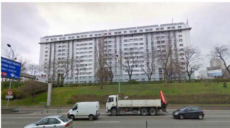
DP 6.1 - Photo du projet