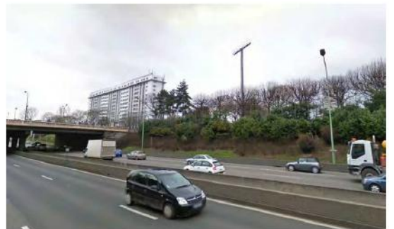
DP 8 - Photo du projet, vue lointaine