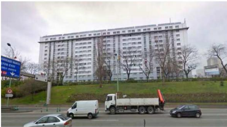
DP 7.1 - Photo de l'existant

REPLACEMENT À L'IDENTIQUE SANS IMPACT VISUEL