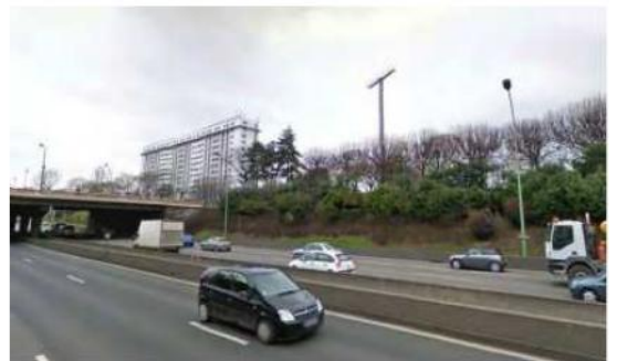
DP 8 - Photo de l'existant, vue lointaine