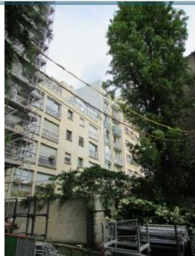
Etat projeté :